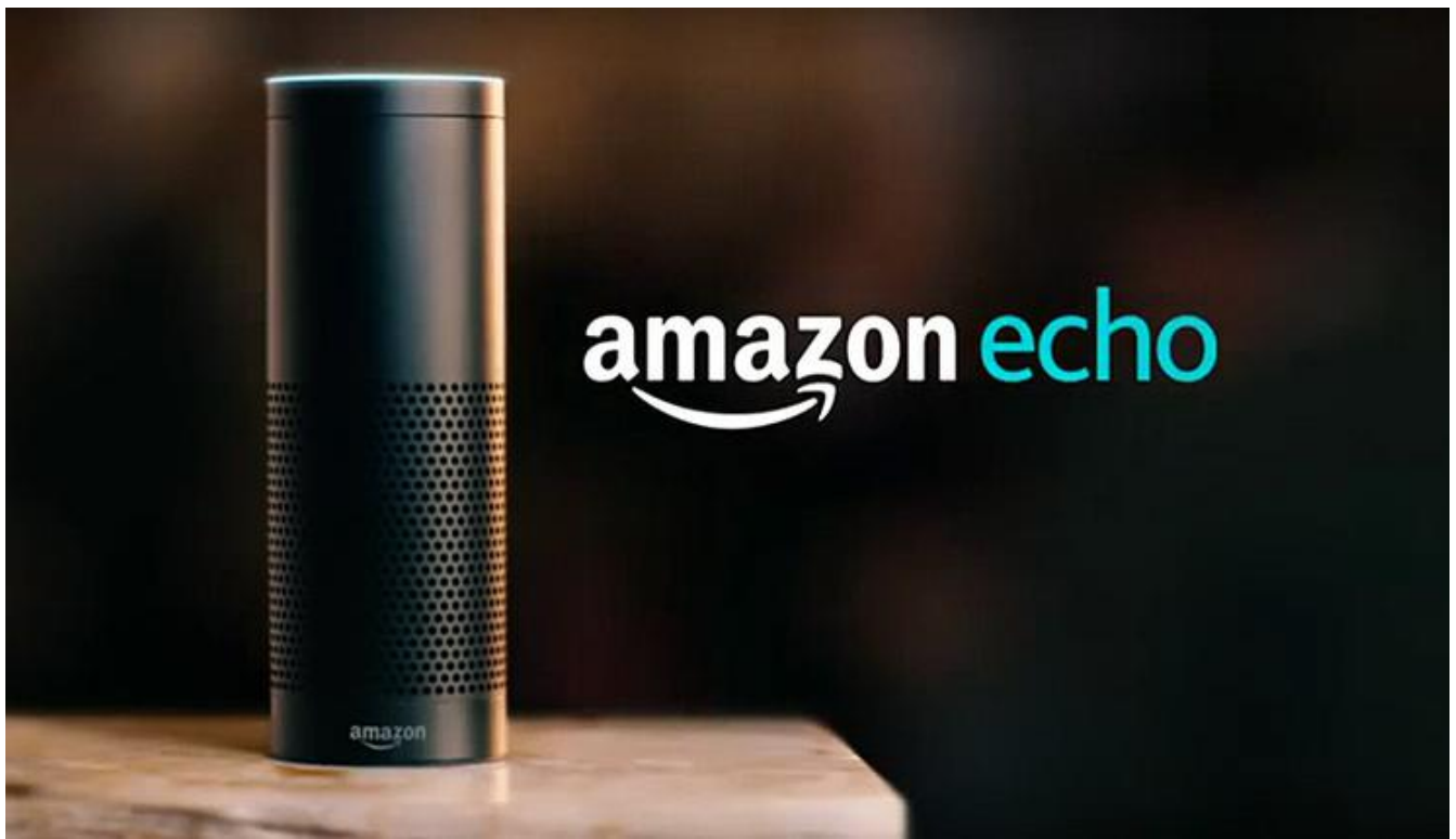
Figure 3. Echo Alexa