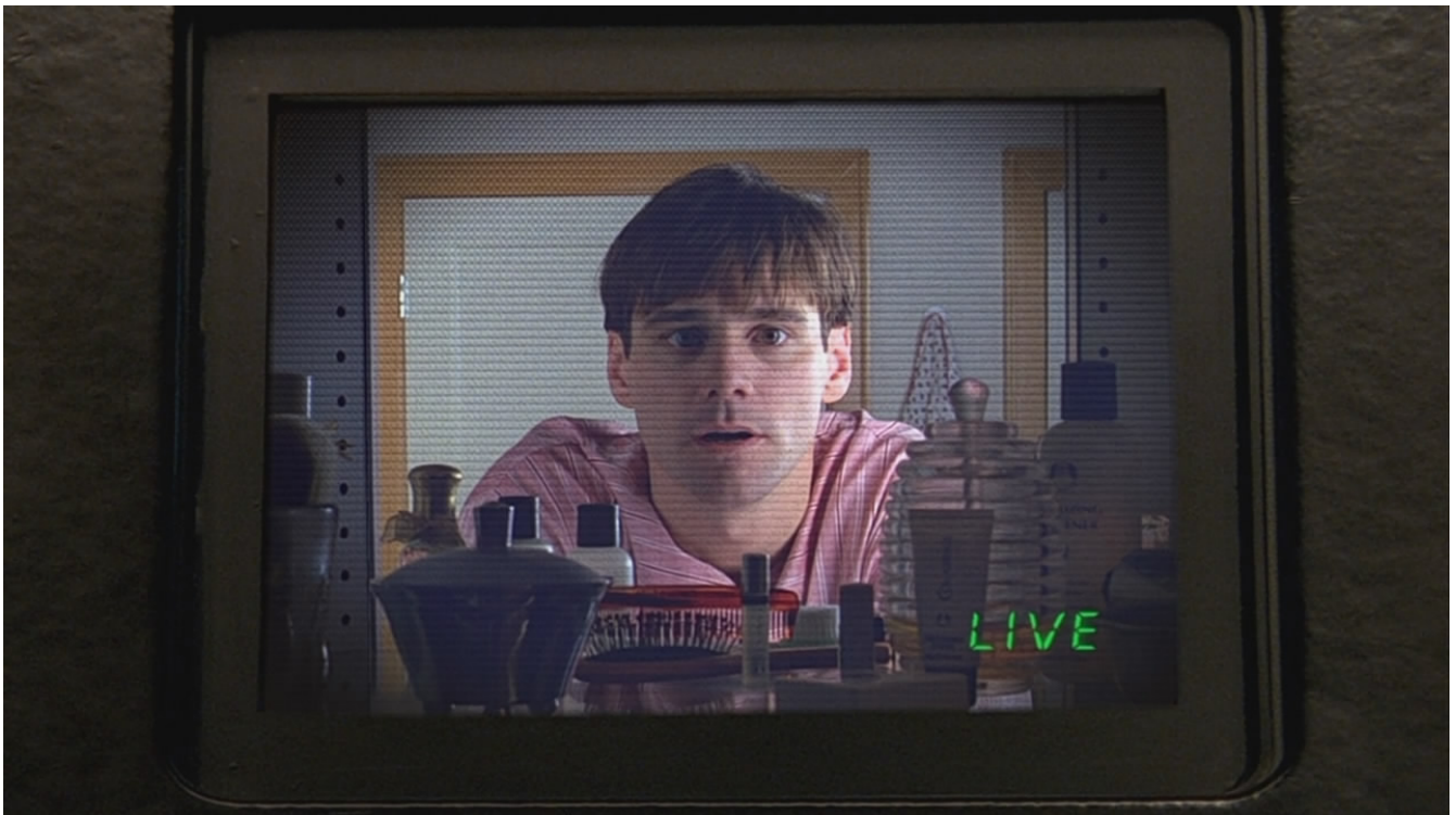
Figure 2. Le Truman Show - film de 1998

Par exemple, la télé-réalité, qui montre des participants filmés 24/24 , et qui révèle leur intimité (réelle ou supposée), ne date que de la fin des années 1990.