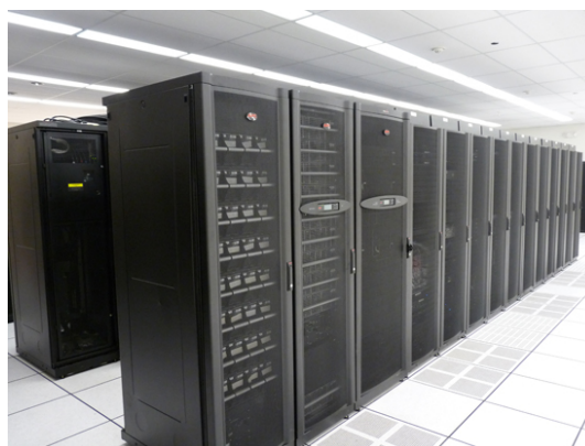
Figure 4. Un centre de données

Lorsque tous les racks de serveurs sont placés dans la même pièce, cela s'appelle un data center et ressemble à ceci: