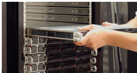
Figure 3. Un rack de serveurs

Jetons un oeil à la forme : rectangulaire et très mince. Cela facilite l'empilement des serveurs les uns sur les autres. Parce que Google et d'autres entreprises ont besoin de beaucoup de serveurs pour gérer leurs données, gagner de l'espace est un véritable problème. Lorsque de nombreux serveurs sont empilés ensemble et mis dans une grande armoire, cela s'appelle un rack de serveurs, et ressemble à ceci :