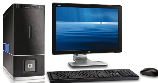
Figure 1. Un ordinateur de bureau

Pour comprendre le cloud précisément, nous devons d'abord avoir une vision claire de ce qu'est un serveur. Un serveur est tout simplement un ordinateur dépourvu de tout ce qui n'est pas essentiel (écran, souris, carte graphique, carte son, clavier) ... Pour illustrer ceci: lorsque Google calcule quels sont les meilleurs résultats pour votre recherche "restaurant bon marché et délicieux à Lyon", ce calcul doit être fait sur un ordinateur, n'est-ce pas? Le type d'ordinateur utilisé pour faire ce calcul n'est pas celui-ci: